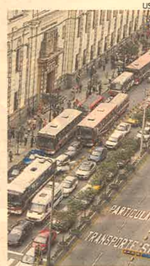
MTC. Llevará al Congreso complementos al proyecto de ATU.

“En materia de tránsito, queremos desde la ATU apro-